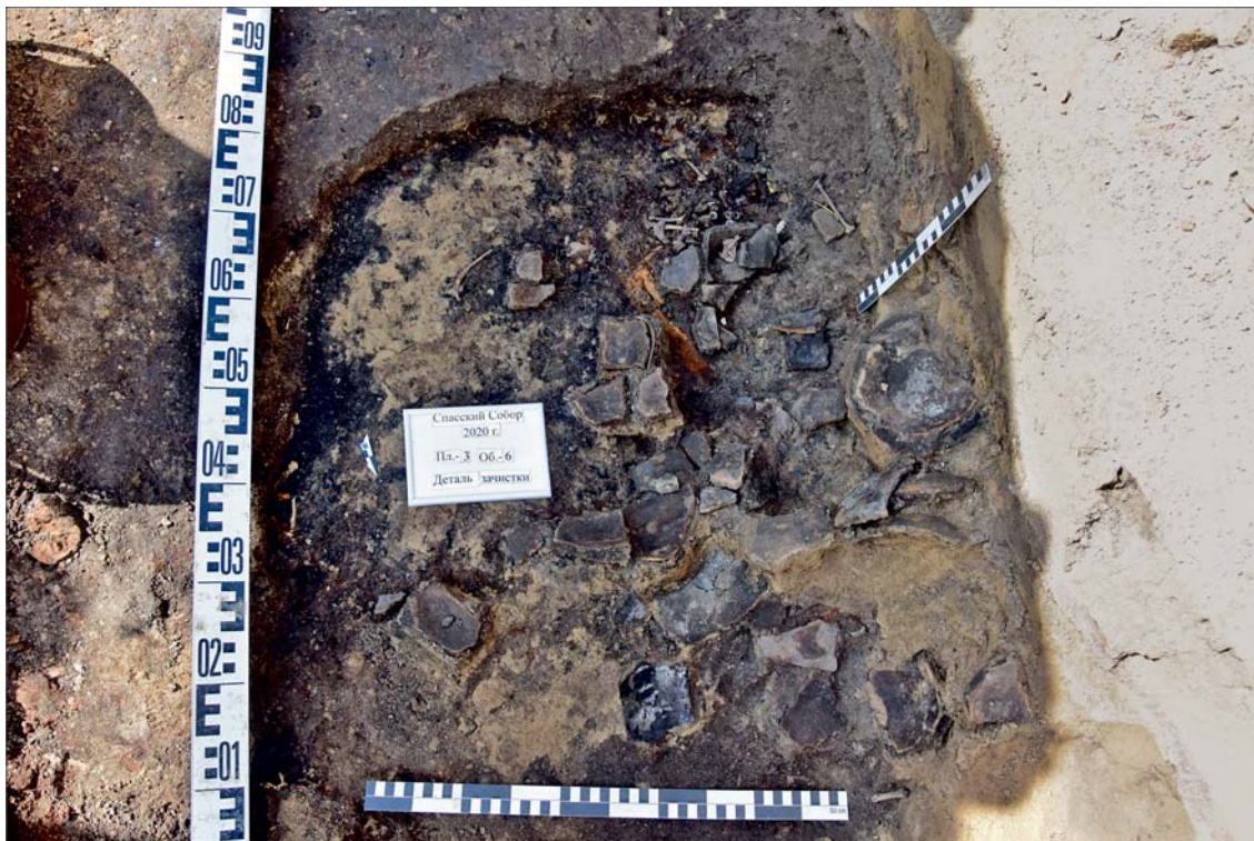
Рис. 2. Фрагмент культурного слоя времени Каинского форпоста на местонахождении «Археологический культурный слой Спасского собора».

всего из лиственницы, заливались известковым раствором, после чего происходила забутовка в несколько слоев битым кирпичом. Поверх забутовки начиналась выкладка кирпичной стены. Затем к существующему фундаменту были пристроены крыльцо с запада, а также приделы с севера и юга. Южный придел («Во имя святителя Христова Николая Чудотворца») был отведен под второй алтарь, его строительство закончилось в 1804 г. [Гусаченко, Матвеева, Тимяшевская, 1995, с. 10]. Северный придел («Во имя Успения Пресвятой Богородицы») отводился под хозяйственно-бытовые нужды, его строительство началось в 1828 г., а освящение последовало в 1836 г. [Там же].