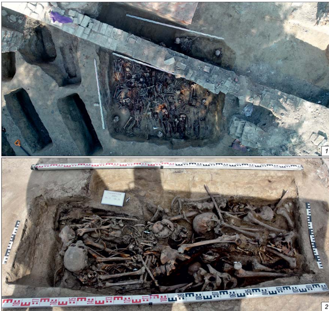
Рис. 3. Коллективные захоронения на местонахождении «Археологический культурный слой Спасского собора».

1 – раскоп 1, площадь 3, объект 28; 2 – раскоп 1, площадь 3, объект 33.