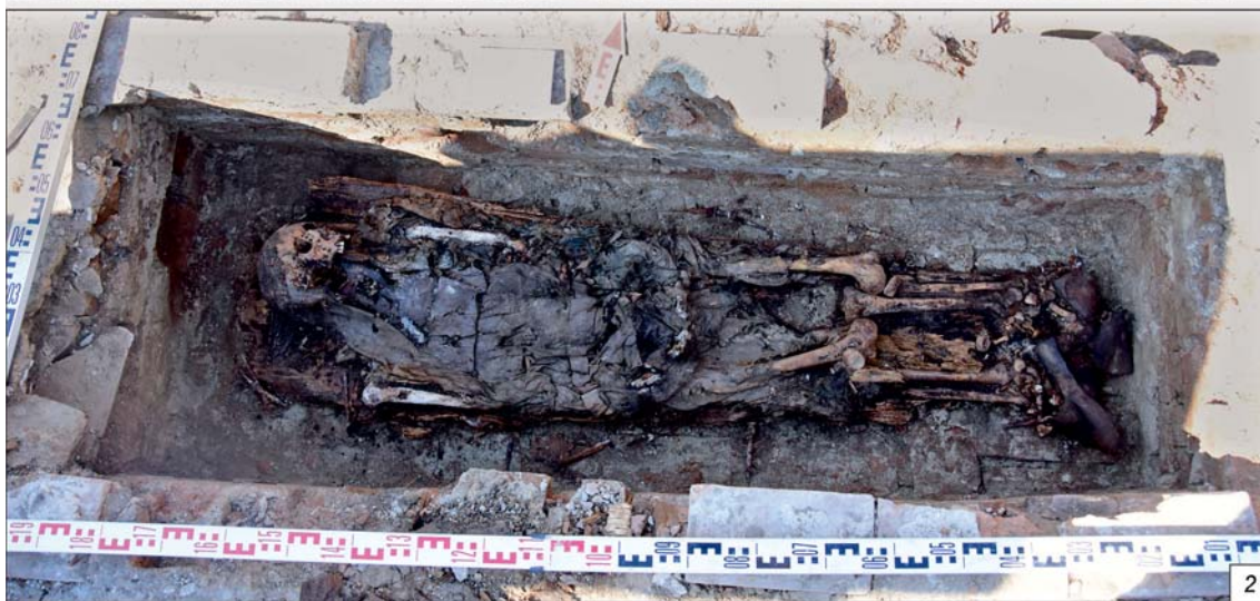
Рис. 4. Склепы. Раскоп 1, площадь 3, объект 5 местонахождения «Археологический культурный слой Спасского собора».