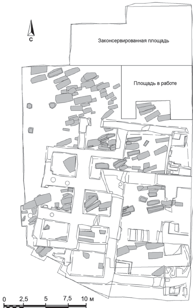
Рис. 3. Планиграфическая ситуация.

Рассмотрим этапы формирования культурного слоя более подробно.