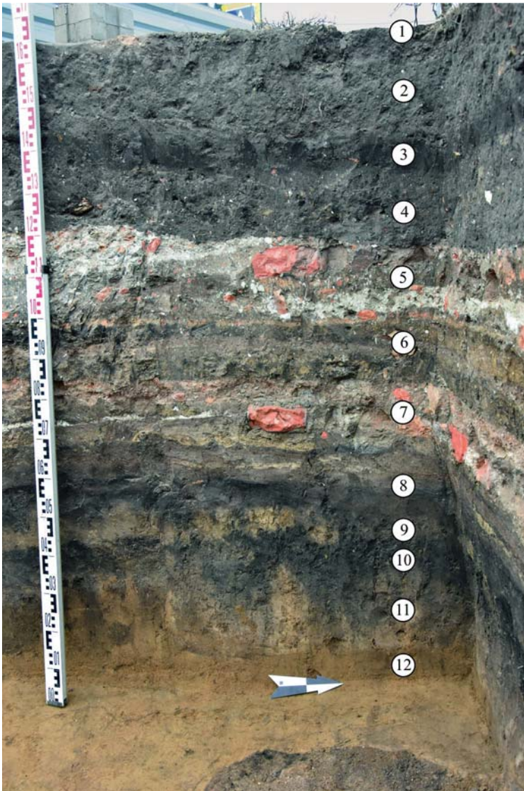
Рис. 2. Стратиграфия археологического культурного слоя Спасского собора.

4) слой темно-серого суглинка с глиной, щебнем и кирпичом, мощностью до 0,25 м;