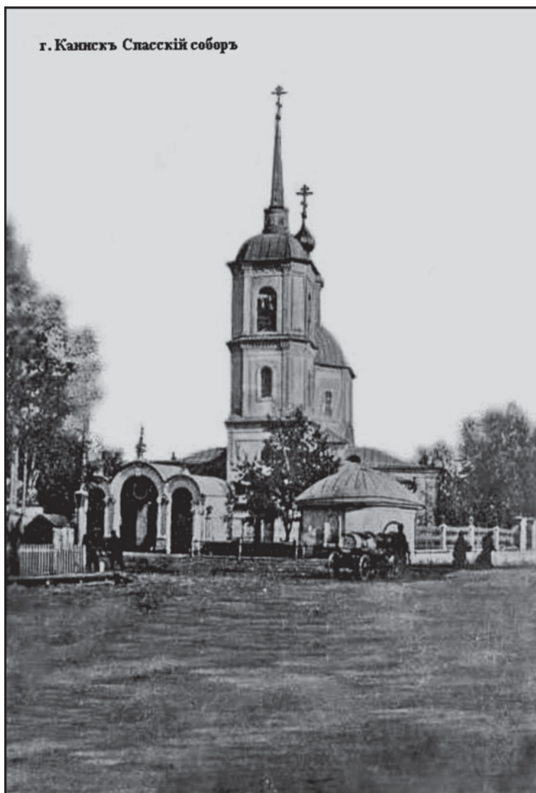
Рис. 1. Спасский Собор. Фото 1903 г..

К 1866 г. происходит стремительное развитие центральной части города. Застройка территории вдоль Московского тракта нарушила визуальное единство соборной и базарной площадей, отделив