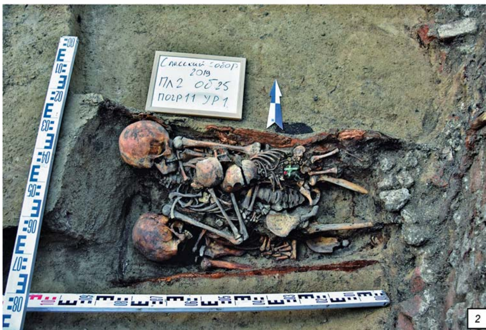
Рис. 5. ВОАН «Археологический культурный слой Спасского собора». 1 – северный придел. Подвал с печным отоплением; 2 – зачистка погребений.